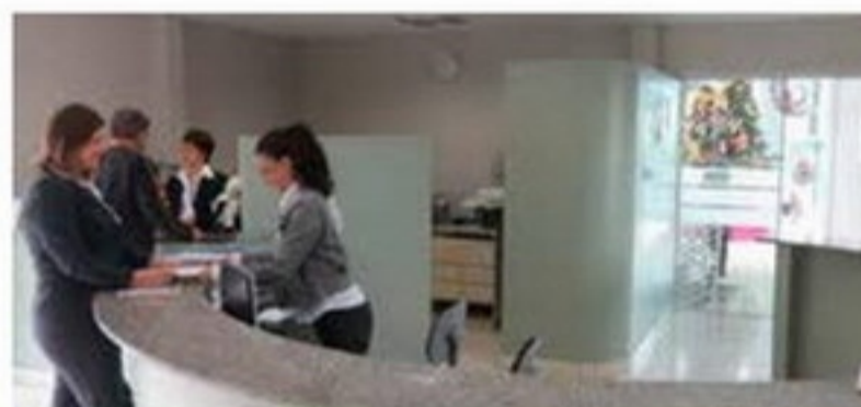
Além de recepcionar os visitantes da Acig, os colaboradores da recepção realizam consultas ao SPC da Acig

Mais do que recepcionar os visitantes da Acig, os colaboradores deste setor realizam as consultas ao SPC da Acig, solicitadas por consumidores da região. Na recepção também são feitos os serviços de fotocópia, encadernação, fax, duplicação e plastificação de documentos a um preço especial para associados. Quando necessário, os colaboradores da recepção auxiliam os demais setores da associação.