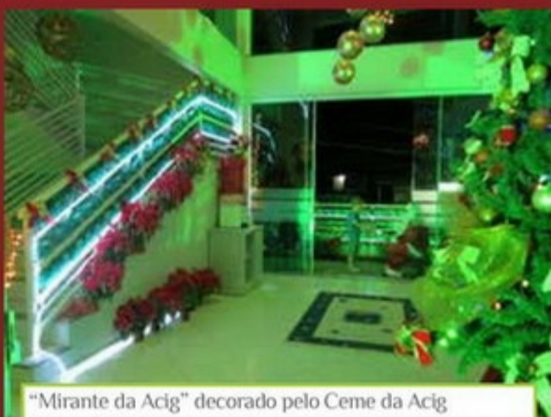
"Mirante da Acig" decorado pelo Ceme da Acig (Conselho da Mulher Executiva) em parceria com a Villena Presentes, Casa Flor, Sensassom e House Homm