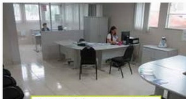
A presença da Jucepar na associação comercial facilita a vida do empresário

e duas atendentes, responsáveis pela realização do processo interno.