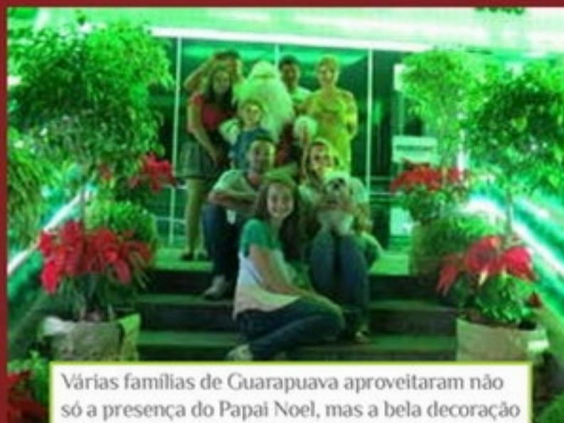
Várias famílias de Guarapuava aproveitaram não só a presença do Papai Noel, mas a bela decoração natalina da Acig para registrar o Natal de 2012