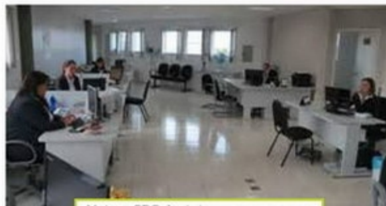
Hoje, o SPC da Acig ocupa a mesma área do departamento comercial

O SPC da Acig (Serviço de Proteção ao Crédito) conta atualmente com três colaboradoras capacitadas a comercializar, treinar e prestar assistência na utilização da BCF (Base Centralizadora da Faciap). O departamento também conta com uma gerente, que direciona os trabalhos e participa de cursos e treinamentos para manter o departamento atualizado. A base é a junção de informações do SPC Brasil, Serasa e Associações Comerciais filiadas à Faciap (Federação das Associações Comerciais do Paraná). O SPC da Acig é a base de dados mais indicada aos empresários guarapuavanos, pois apresenta informações regionais, estaduais e nacionais de clientes.