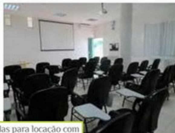
A Acig possui salas para locação com capacidade para 40, 70 e 25 lugares