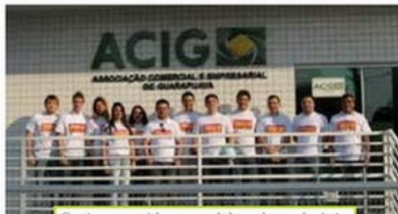
Conjove reunido com colaboradores da Acig para realização do Feirão do Imposto 2012