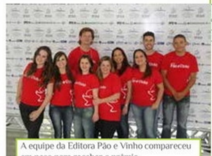
A equipe da Editora Pão e Vinho compareceu em peso para receber o prêmio