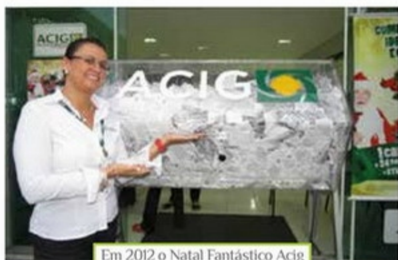
Em 2012 o Natal Fantástico Acig ganhou nova urna

Quem não ganhou presente do papai noel no Natal de 2012 teve uma segunda chance com o Natal Fantástico Acig. A campanha de incentivo às vendas premiou trinta consumidores do comércio local. Dia 28 de dezembro foram sorteados 1 Gol geração 4; 1 moto CG 125 Fan; 24 vales-compras de R$ 500,00 cada; 2 TV's Led 32" e 2 I pads. Mais de 150 mil cupons circularam no comércio guarapuavano entre 1º de novembro e 26 de dezembro.