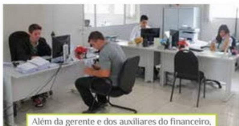
Além da gerente e dos auxiliares do financeiro, o departamento conta com dois motoboys