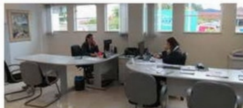
As secretárias da Acig também são responsáveis pela realização dos eventos da entidade

A secretaria da Acig conta com uma secretária dos conselhos e uma secretária executiva. A primeira auxilia o Ceme e o Conjove na realização de reuniões e eventos, além de dar ao comercial o apoio necessário para a realização de grandes eventos, como o Jantar do Empresário. Já a secretária executiva está diretamente ligada à diretoria, guiando presidente e diretores sobre seus compromissos com a entidade, já que estes não estão diariamente na Acig por não serem funcionários. ▶