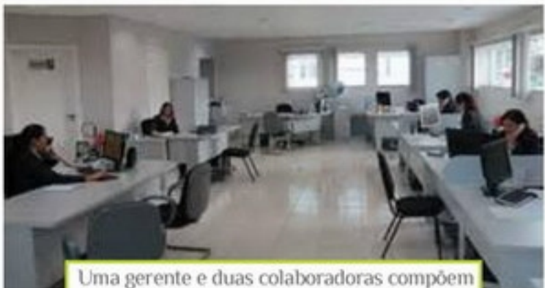
Uma gerente e duas colaboradoras compõem o departamento comercial da Acig

O comercial é o departamento que mais movimenta a Acig. Uma gerente e três colaboradoras são os responsáveis pela comercialização de cursos, campanha de incentivo às vendas, publicidade na Revista Acig, patrocínios para realização de eventos e associação de novas empresas. As colaboradoras deste setor mantêm contato direto com os associados da Acig, realizando visitas periódicas.