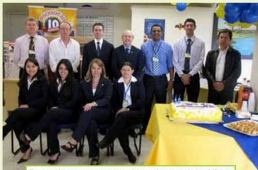
Equipe J Losso em comemoração aos dez anos da imobiliária