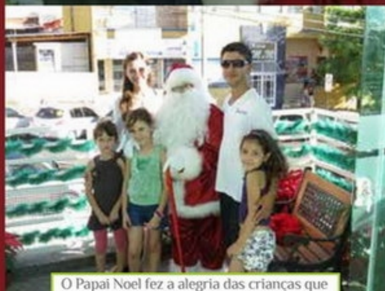
O Papai Noel fez a alegria das crianças que visitaram a Acig durante o período natalino