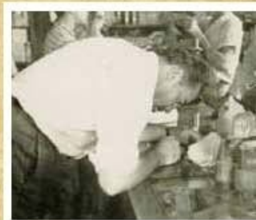
▲ Na época de Leopoldo Bischof, a Casa Favorita comercializava, dentre outros produtos, secos e molhados

A fachada da loja foi pintada, mas, a estrutura continua a mesma. Janelas, balcões e prateleiras são mais antigos do que muitas lojas existentes hoje no comércio de Guarapuava. Os próprios clientes pedem para que os comerciantes não mexam no visual da loja, para que ela não perca sua identidade. “Este tipo de comentário partiu até de uma consultora do Sebrae, o que nos deixa lisonjeados. Nessas horas percebemos que não é só a modernização de uma loja que traz clientes. A tradição e conhecimento de que lá existe um serviço bem feito sendo prestado, é o ponto principal”, finalizam. ■